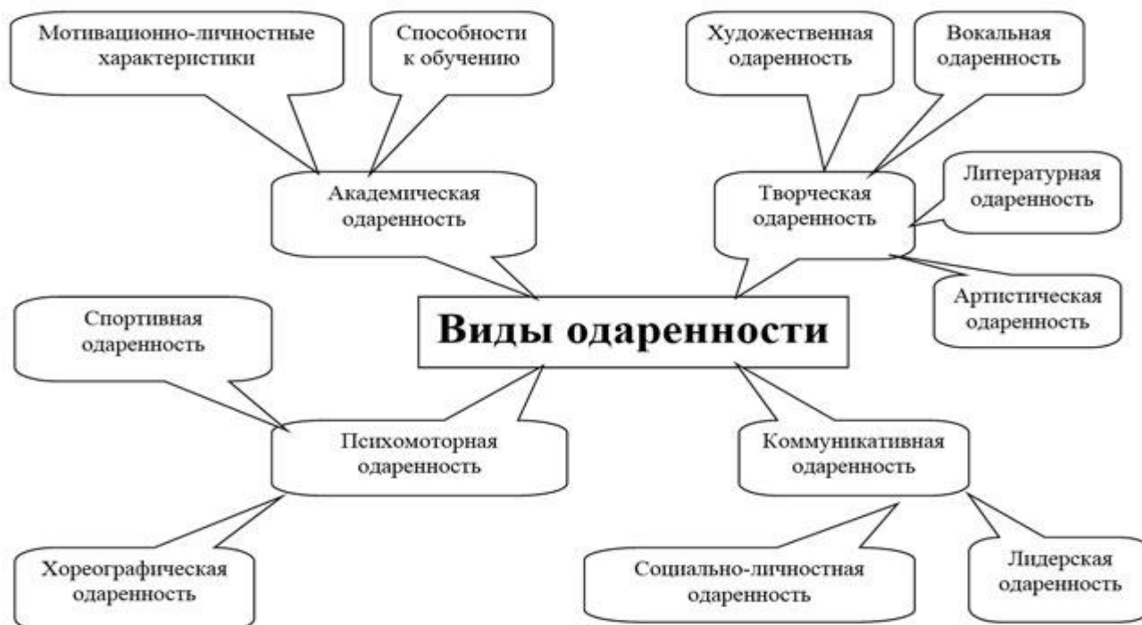
Схема № 1 «Виды одаренности в зависимости от вида предпочитаемой деятельности»

Более подробно виды одаренности в зависимости от вида предпочитаемой деятельности показаны на схеме № 1 и в таблице № 2.