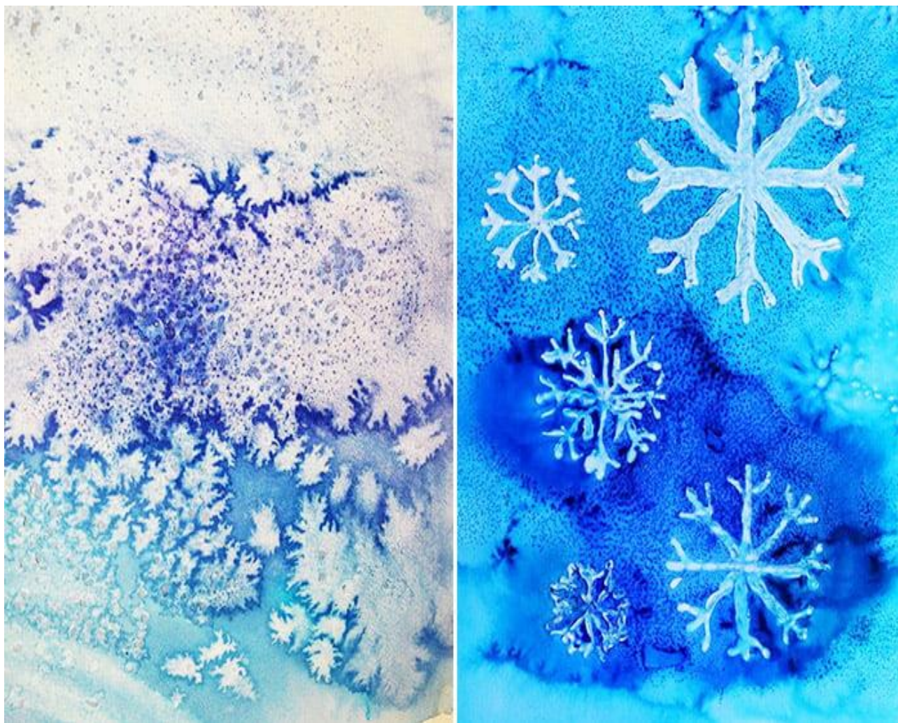
Образцы рисования солью.