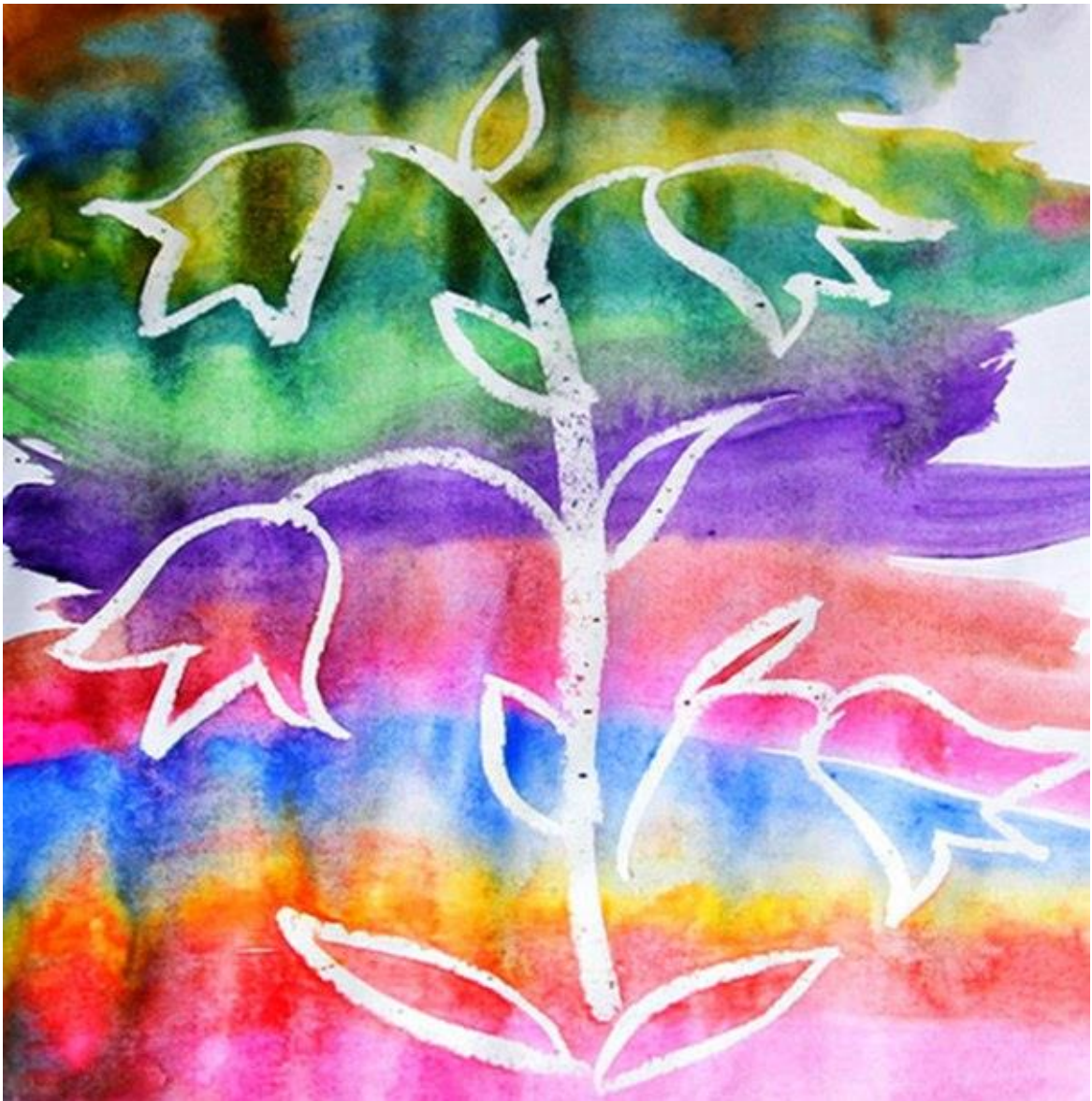
Пейзаж , нарисованный с помощью поролона.