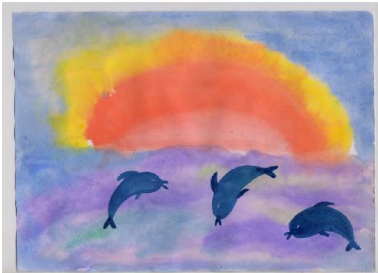
Дельфины в море

Обратите внимание! После высыхания фона можно добавить к рисунку какие-либо детали: птиц, рыб или же контур.