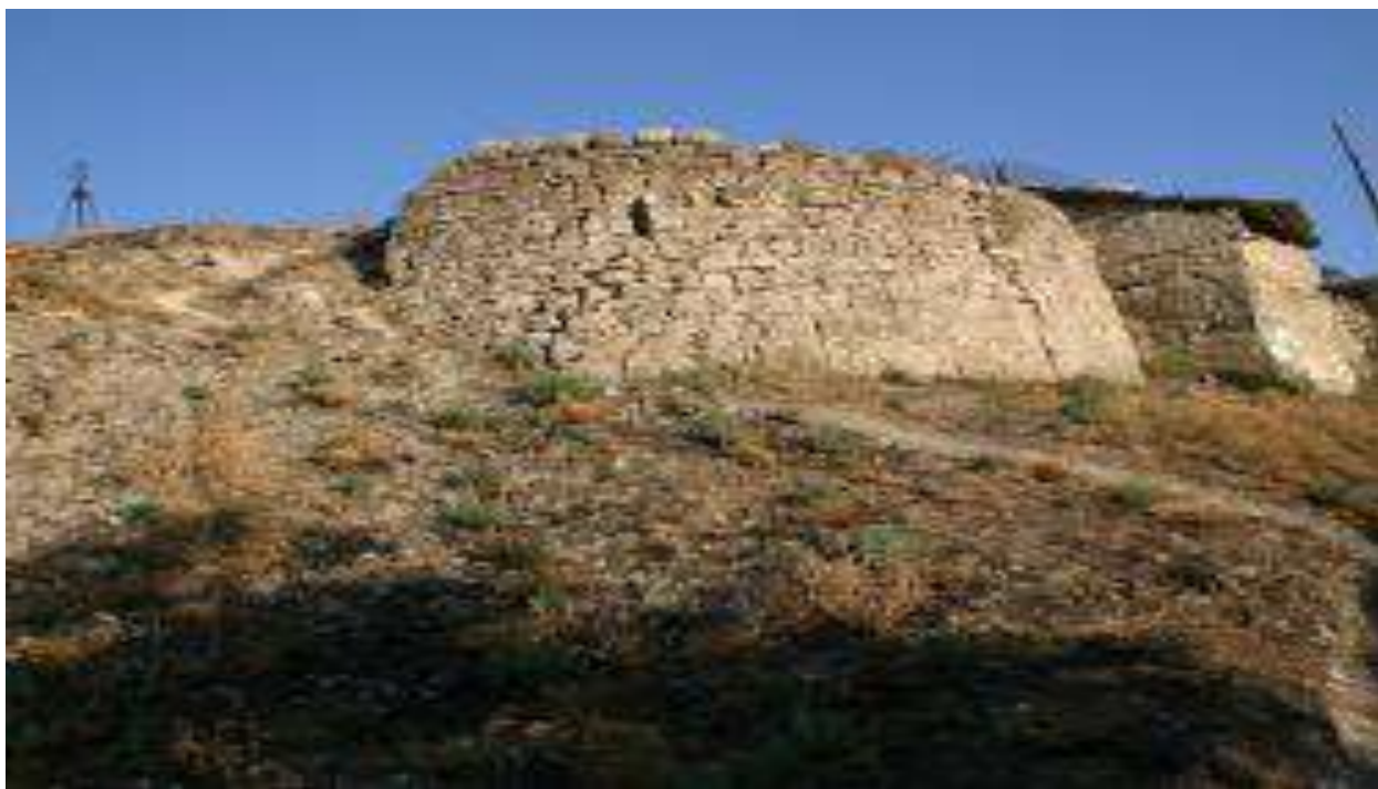
Остатки башни Святого Фомы на холме Митридат

В средние века холм играл важную роль в обороне города от нападений с моря, он был частью крепостной стены, опоясывавшей город со всех сторон. Сейчас от этих фортификационных сооружений сохранились только руины башни святого Фомы.