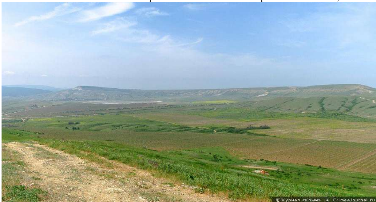
Хребет Узун-Сырт или гора Клементьева