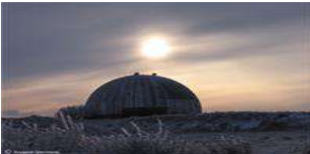
Купол радиолокационной станции на Тепе - Оба

На вершине горы издали видны белые купола радиолокационной станции. С 2011 года хребет стал ботаническим заказником. Его площадь 1200 гектар. В 2015-м он стал Государственным природным заказником.