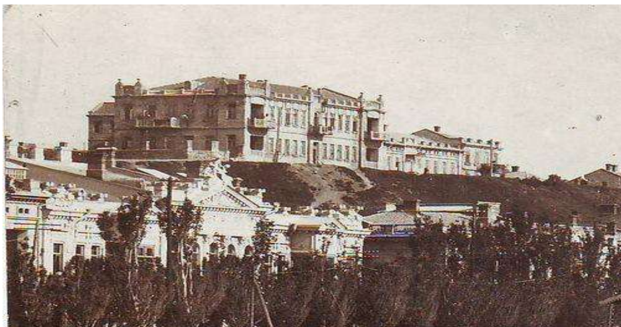
Бульварная горка в начале XX века

Одно из самых живописных и любимых мест феодосийцев и гостей города, находящихся в центре города, - это Бульварная горка. Но когда-то на ее вершине стояла турецкая крепость Топрак-Кале, которую штурмовали русские войска под командованием генерал-аншефа, князя Василия Долгорукова.