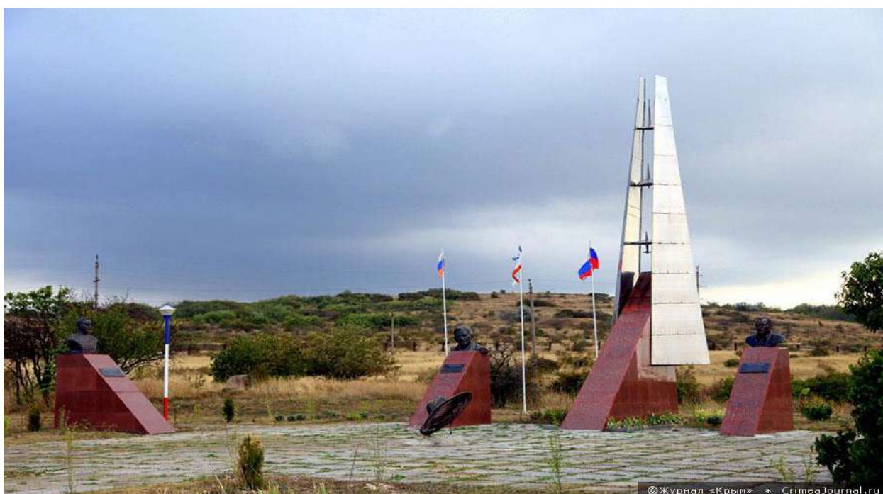
Аллея славы на горе Клементьева

Семиметровый постамент, обитый серебристым дюралем, был увенчан цельнометаллическим рекордным планером А-13. Это был подарок антоновцев. Сильные порывы ветра несколько раз срывали планер с постамента. В 2003 году памятник был реконструирован, вместо настоящего планера поместили легкую модель, Модель планера, как флюгер, поворачивается согласно направлению ветра. На обелиске на мраморной доске высечены слова О.К. Антонова: «Пока будут восходящие потоки – будут люди, стремящиеся летать» . Чуть ниже надпись: «Первопроходцам и романтикам неба в честь 100-летия авиации и 80-летия планеризма 1903 1923-2003» . В 2011 году на горе Клементьева была открыта Аллея славы авиации и космонавтики.