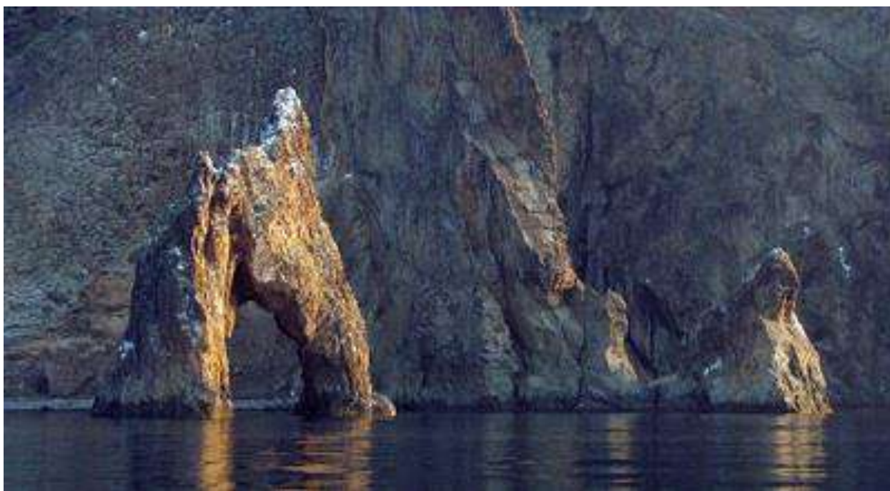
Скала Золотые Ворота, справа скала Лев.

Береговая линия Карадага изрезана небольшими бухтами - Сердоликовая, Лягушачья, Барахта, и др. которые разделены скалами Иван-Разбойник, Лев, Маяк, Слон и др. Визитной карточкой Кара – Дага является скала Золотые Ворота.