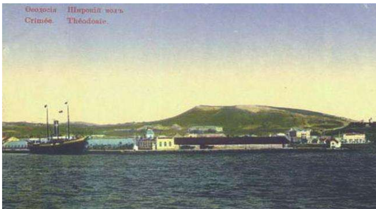
Гора Лысая прежде.

Гора Лысая (прежнее название Паша-Тепе, с крымско-татарского «царь-гора») – невысокая (167 м) гора-останец (т.е. отдельно стоящая), находится западнее Феодосии. Народное название «Лысая» гора получила не случайно: она и была такой, на ней ничего не росло.