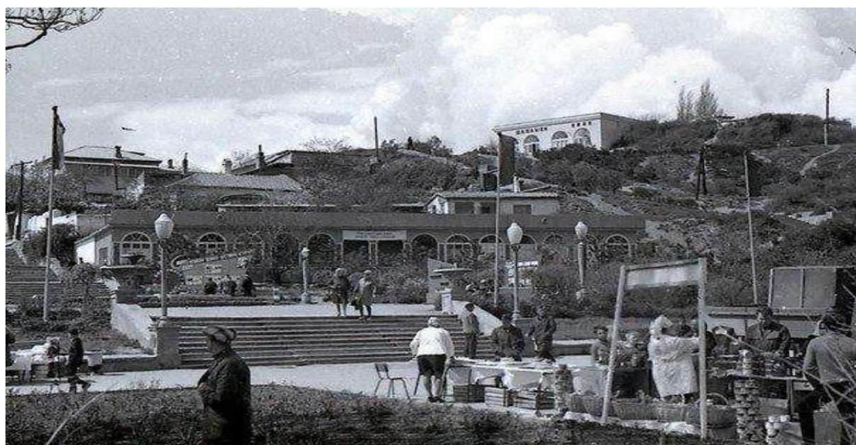
Бульварная горка в 60-х годах XX века.

В начале XX века на Бульварной горке возвышалось громоздкое жилое здание. Также здесь находился парк и популярный среди феодосийцев бульвар. Позже на горке красовался ресторан Южный, была известная в городе шашлычная, горожане любили отдыхать здесь.