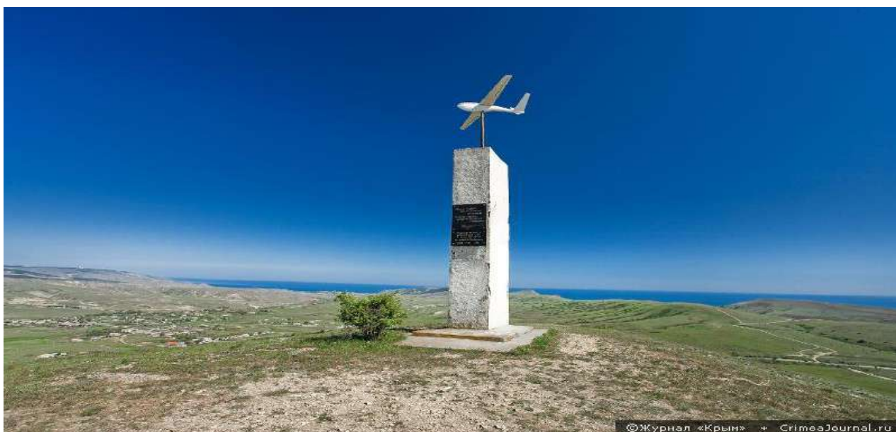
Памятный обелиск на горе Клементьева