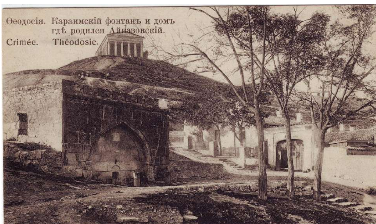
Справа дом художника И.К. Айвазовского, рядом караимский фонтан 16 века.

Названием «Митридат» гору окрестил самый известный уроженец Феодосии – художник И.К. Айвазовский в честь понтийского царя Митридата IV Евпатора. Он родился в домике совсем рядом с этим местом и, вероятно, часто здесь бывал с самого детства, что объясняет любовь к нему художника.