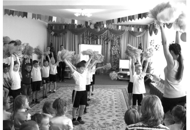
Все этапы соревнования проходили в напряженной борьбе

В дни весенних каникул в детском саду №11 «Сказка» была проведена спартакиада.