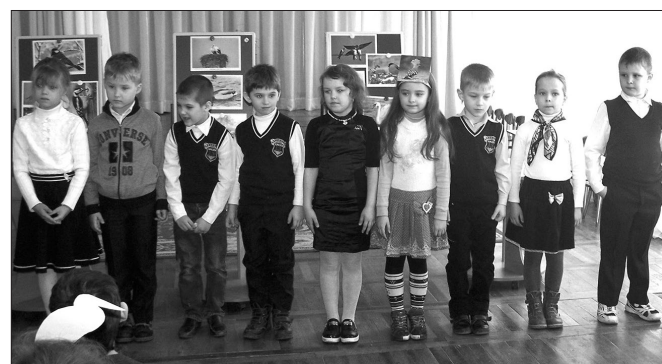
Дети показали хорошие знания о птицах

Гнездятся удода в основном в норах на песчаных и глинистых обрывах. Еще в конце 90-х в степном Крыму и в природном заповеднике «Опукский» они были очень обычны. В последние годы здесь отмечаются лишь единичные пары этих замечательных птиц.